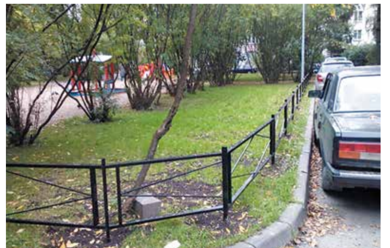
Заневский проспект, д. 24

Свои предложения и пожелания вы можете направить по электронной почте to.malayaохта@mail.ru или по адресу: 195112, Санкт-Петербург, Новочеркасский пр., д. 25, корп. 2, лит. А.