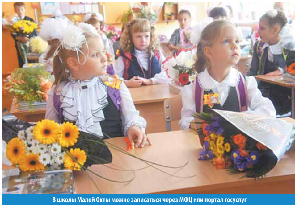
В школы Малой Охты можно записаться через МФЦ или портал госуслуг

20 января в Санкт-Петербурге стартовал основной этап записи в первые классы на 2016/2017 учебный год. Все собранные в последующие 30 дней заявления будут накапливаться в единой информационной базе и по истечении этого срока обрабатываться без учета даты и времени подачи документов.