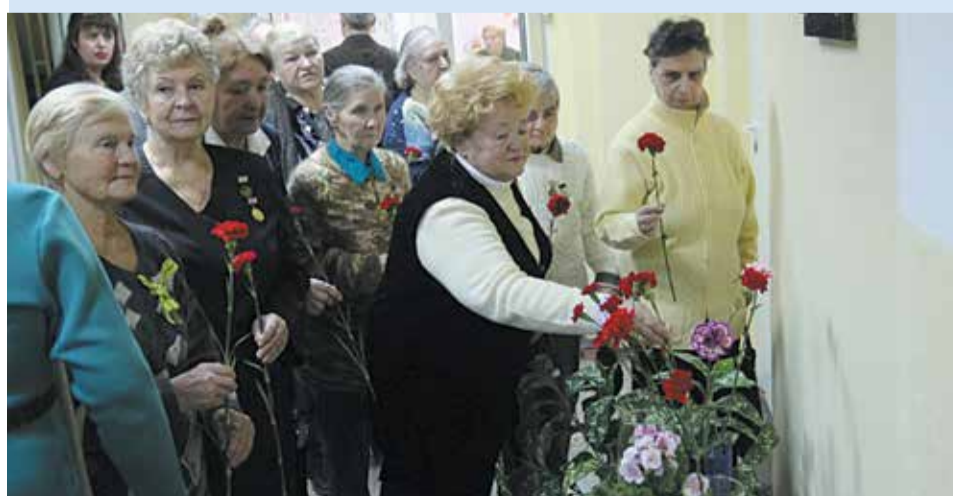
Праздник в школе №499

которые вручили им цветы и открытки собственного изготовления.