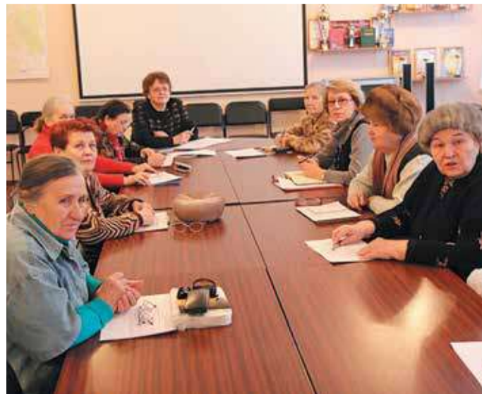
Январская встреча с руководителями общественных организаций

15 января на Малой Охте состоялось собрание руководителей общественных организаций, работающих на территории округа. Главной темой стала подготовка к мероприятиям, посвященным 73-й годовщине прорыва блокады Ленинграда и 72-й годовщине полного освобождения Ленинграда от фашистской блокады.