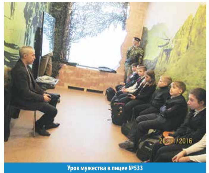
Урок мужества в лицее №533

ческих событиях от их непосредственных участников, которые, к тому же, живут по соседству.