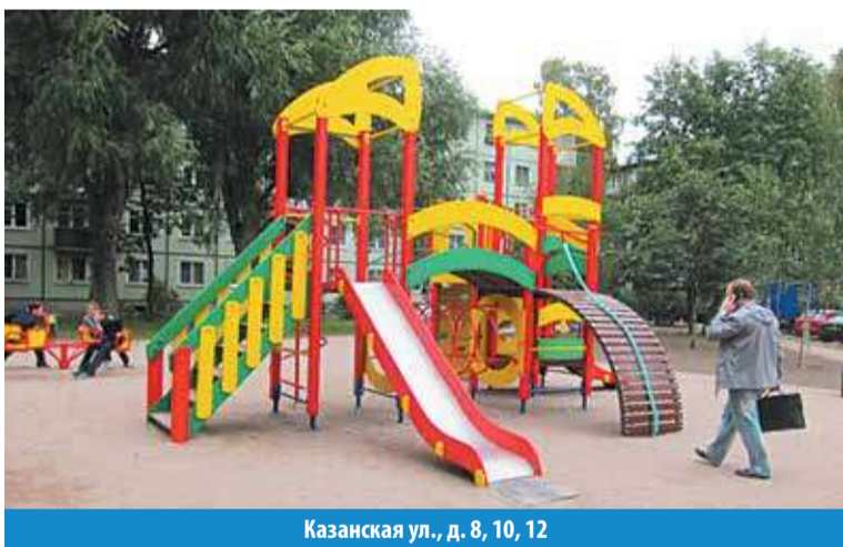
Казанская ул., д. 8, 10, 12

Красивый благоустроенный двор – мечта каждого горожанина. В МО Малая Охта делают все возможное, чтобы сделать округ красивым и комфортным для проживания. Именно поэтому значительная часть бюджета муниципального образования направляется на благоустройство.