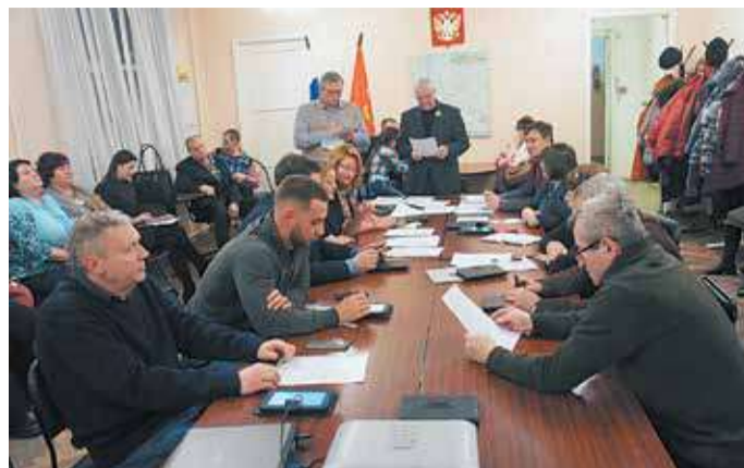
Январское заседание Муниципального Совета МО Малая Охта

25 января Муниципальный Совет МО Малая Охта 5-го созыва провел первое в 2016 году заседание. Центральной темой повестки дня стал отчет Главы МО Малая Охта перед депутатами о результатах своей деятельности в 2015 году.