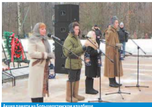
Акция памяти на Большеохтинском кладбище

26 и 27 января ветераны совершили автобусные экскурсии на Дорогу жизни, а 28 января блокадников ждал концерт в КДЦ «Красногвардейский» (подробности читайте на стр. 4–5).