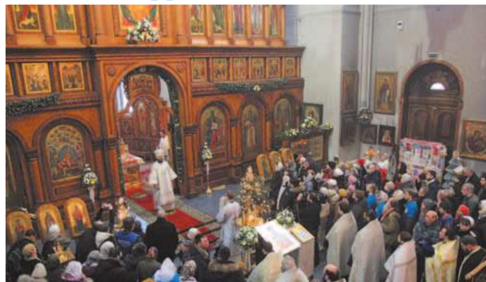
Встреча иконы Стефана Великопермского