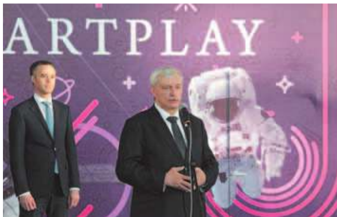
Губернатор на открытии Центра дизайна

21 января губернатор Георгий Полтавченко провел выездной инвестиционный объект Санкт-Петербурга. В выездном совещании приняли участие члены городского правительства, руководители отраслевых комитетов и районных администраций. На совещании речь дважды заходила об объектах, расположенных в нашем районе.