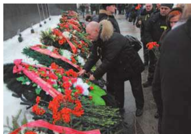
Торжественно-траурная церемония на Пискаревском кладбище

К 27 января на Малой Охте приурочили серию мероприятий для ветеранов и молодежи. В кинотеатре «Заневский» прошли показы нашумевшего фильма «28 панфиловцев»,