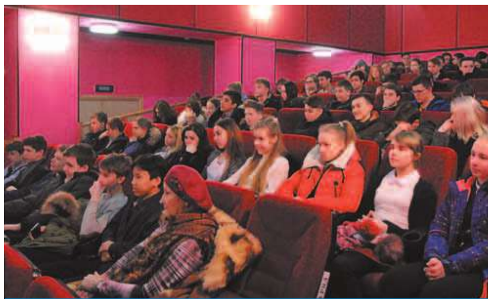
Кинопоказы в «Заневском» к 27 января

Аналогичные кинопоказы ждали школьники: 26 декабря около 200 подростков посмо-