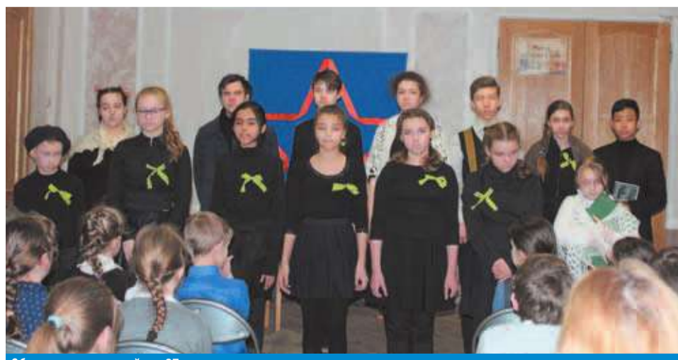
Общешкольная линейка к 27 января

Малоохтинское кладбище и возложили цветы к мемориалам защитникам города, погибшим в годы Великой Отечественной войны.