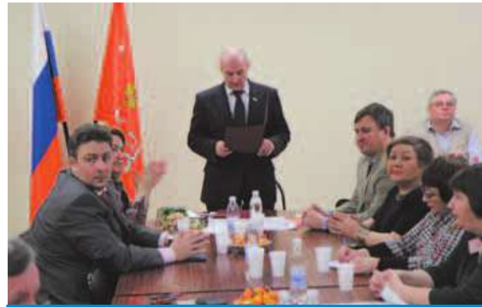
Январское заседание Муниципального Совета

Вместо традиционного разрезания ленточки организаторы церемонии предложили губернатору разбить молотком ткань, пропитанную жидким азотом. Очевидно, это решение должно было символизировать нетривиальное будущее нового пространства.