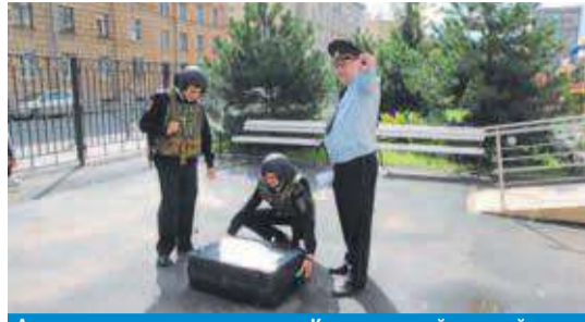
Антитеррористические учения в Красногвардейском районе

не ведется ли разгрузка мешков или ящиков, не появились ли во дворе брошенные автомобили.