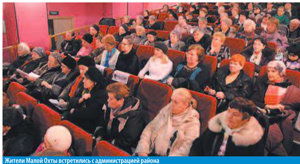
Жители Малой Охты встретились с администрацией района

По-прежнему остро стоит вопрос с автомобилистами, которые паркуют машины на газонах. Так, жители пожаловались, что двор между домами 19 и 21 по Заневскому проспекту давным-давно превращен в автостоянку: газон разбит, а «железных коней» владельцы бросают так, что порой сложно подобраться к подъезду. На проблемный адрес в муниципалитете уже давно обратили внимание: благоустроить двор планировалось еще в 2015 г. Помешал «Петербурггаз», который планирует работы на этом участке. «Как только «Петербурггаз» закончит работы, муниципальное образование Малая Охта приступит к комплексному благоустройству, включающему ремонт дворового проезда, организацию дополнительных парковочных мест, установку