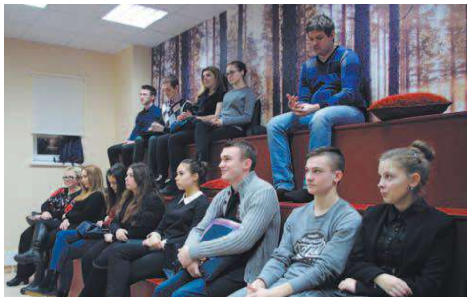
Дом молодежи. Круглый стол «Что такое государственная служба»

ПО ДАННЫМ НА ЯНВАРЬ 2017 ГОДА ДОМ МОЛОДЕЖИ «КВАДРАТ» РЕГУЛЯРНО ПОСЕЩАЮТ БОЛЕЕ 850 ЧЕЛОВЕК. ЭТО ПОКАЗАТЕЛЬ ТОГО, ЧТО УНИКАЛЬНАЯ ПЛОЩАДКА НЕОБХОДИМА МОЛОДЕЖИ КРАСНОГВАРДЕЙСКОГО РАЙОНА.