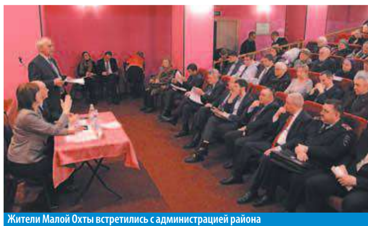
Жители Малой Охты встретились с администрацией района