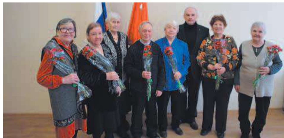
Поздравление февральских юбиляров