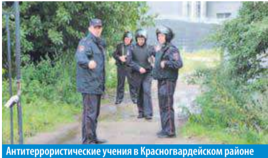
Антитеррористические учения в Красногвардейском районе

Всегда узнавайте, где находятся резервные выходы из помещения. Не открывайте дверь в подъезд незнакомцам. Проверьте, закрыты ли входы в подвалы и на чердаки. Не лишним будет организовать дежурство среди активных жителей, которые будут регулярно обходить здание и проверять,