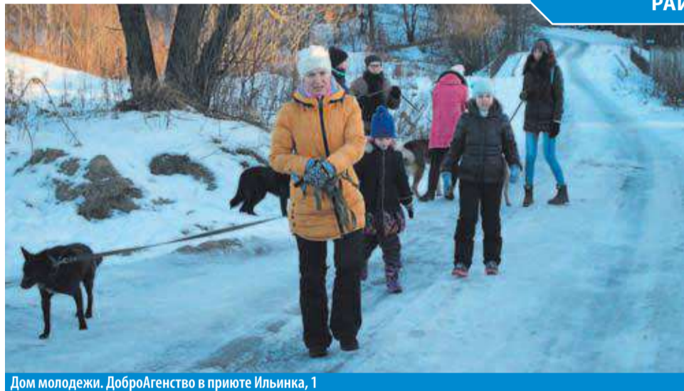
Дом молодежи. ДоброАгентство в приюте Ильинка, 1

На сегодняшний день нет ни одного похожего объекта, который совмещал бы в себе столько направлений. Благодаря современному оснащению «Квадрата» есть возможность оперативно реагировать на современные тенденции в молодежной политике, что позволяет в короткие сроки запустить новое направление.