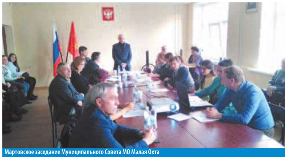
Мартовское заседание Муниципального Совета МО Малая Охта

Продолжилась работа по сохранению и развитию местных традиций и обрядов. Были организованы поздравления 450 юбиляров (80, 85, 90 лет и старше), а также 10 супружеских пар-юбиляров. Красочное поздравление было организовано для победителей конкурсов «Лучшее благоустройство» и «Ветеранское подворье».