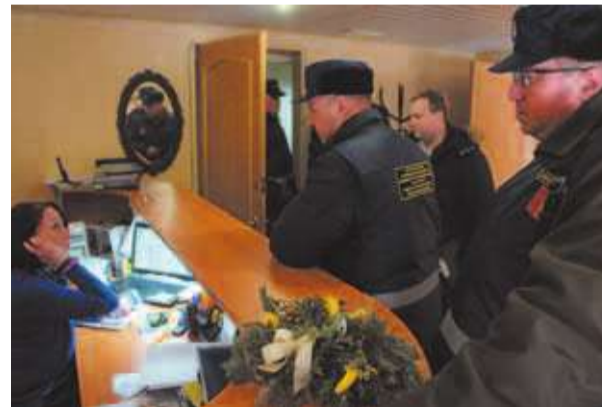
Сообщить о незаконной рекламе вы можете по телефону: 242-30-32.