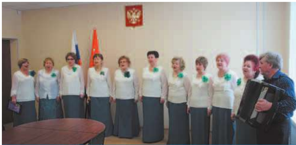
Выступления коллектива «Надвечерье»