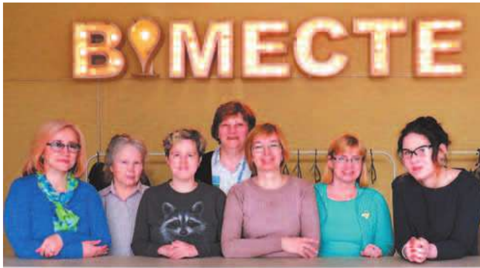
Коллектив библиотеки «Современник»

– А почему бы и нет – библиотека может стать модным местом: местом со стильным