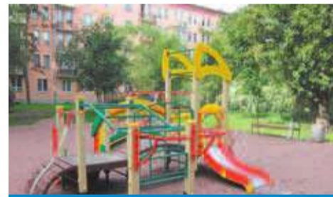
Детская площадка на Новочеркасском пр., 61 после ремонта

Особенно теплые слова благодарности прозвучали в адрес жителей, которые на протяжении многих лет оказывают помощь и принимают активное участие в жизни муниципального образования.