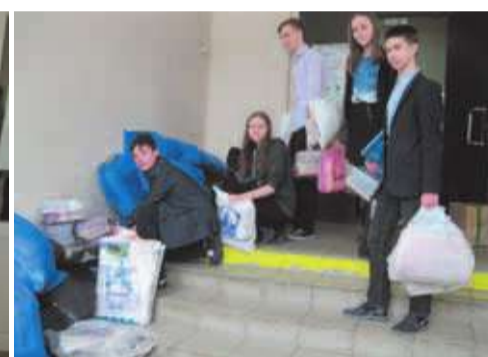
Экологический проект в школе № 3