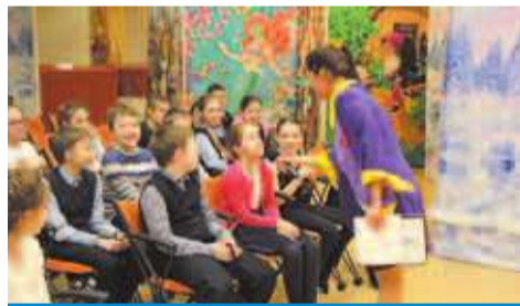
Новогоднее представление в КДЦ «Красногвардейский»