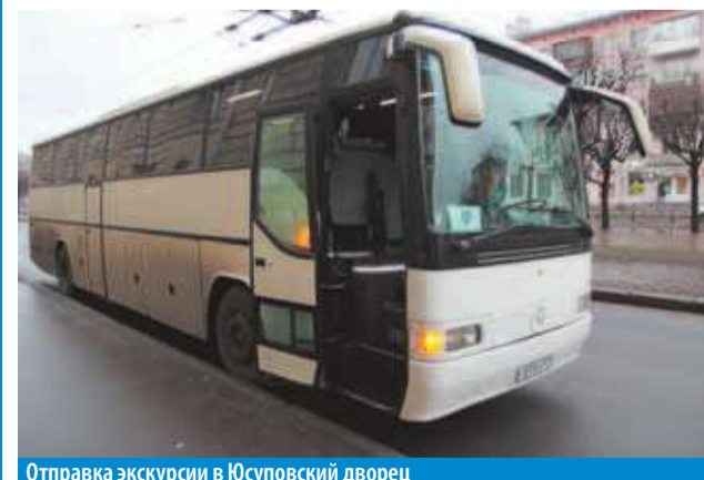
Отправка экскурсии в Юсуповский дворец

Напомним, что получить информацию об экскурсионных поездках и их расписании, вы можете в Общественной приемной (Новочеркасский пр., д. 49/20).