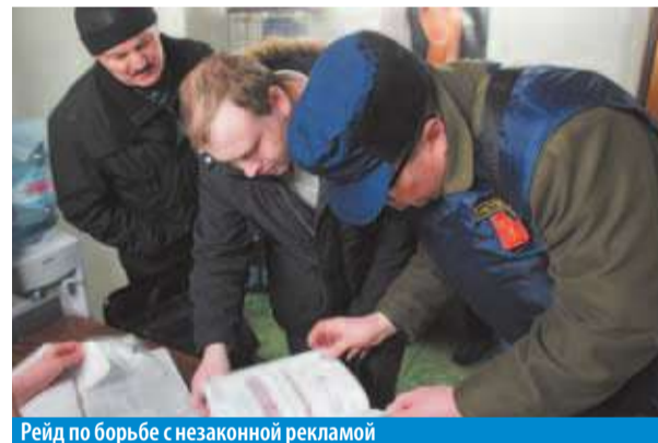
Рейд по борьбе с незаконной рекламой

Самое распространенное нарушение – установка стритлайнов, выносных рекламных конструкций, знакомых многим жителям. Как пояснили в отделе муниципального хозяйства Местной администрации МО Малая Охта, в Петербурге не выдаются разрешения на установку стритлайнов, а значит, все подобные конструкции