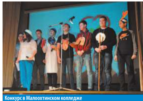
Конкурс в Малоохтинском колледже

«Здоровый образ жизни очень важен. Спорт, здоровое питание, соблюдение режима – должны стать частью жизни каждого человека, который хочет быть бодрым и ак-