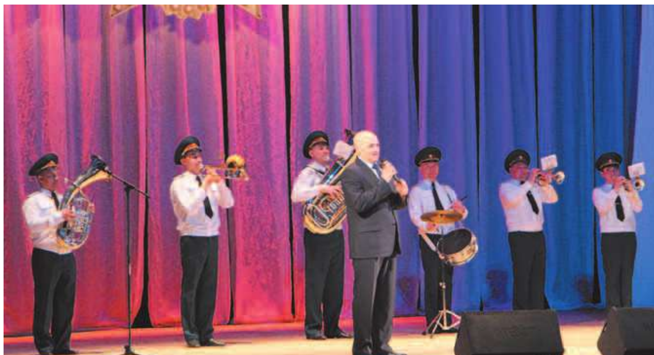
Праздничный концерт в ДК «Ленсовета»

4 мая в ДК «Ленсовета» состоялся праздничный концерт, приуроченный к 9 мая. В этот вечер ветераны и жители Малой Охты услышали любимые песни военных лет и песни о Победе.