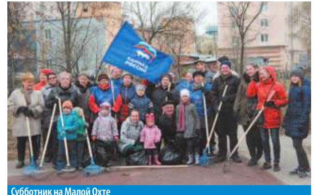
Субботник на Малой Охте

«Профессионалы чистоты убирают город круглосуточно семь дней в неделю месяц за месяцем. Но когда на генеральную уборку выходят тысячи горожан – День благоу-