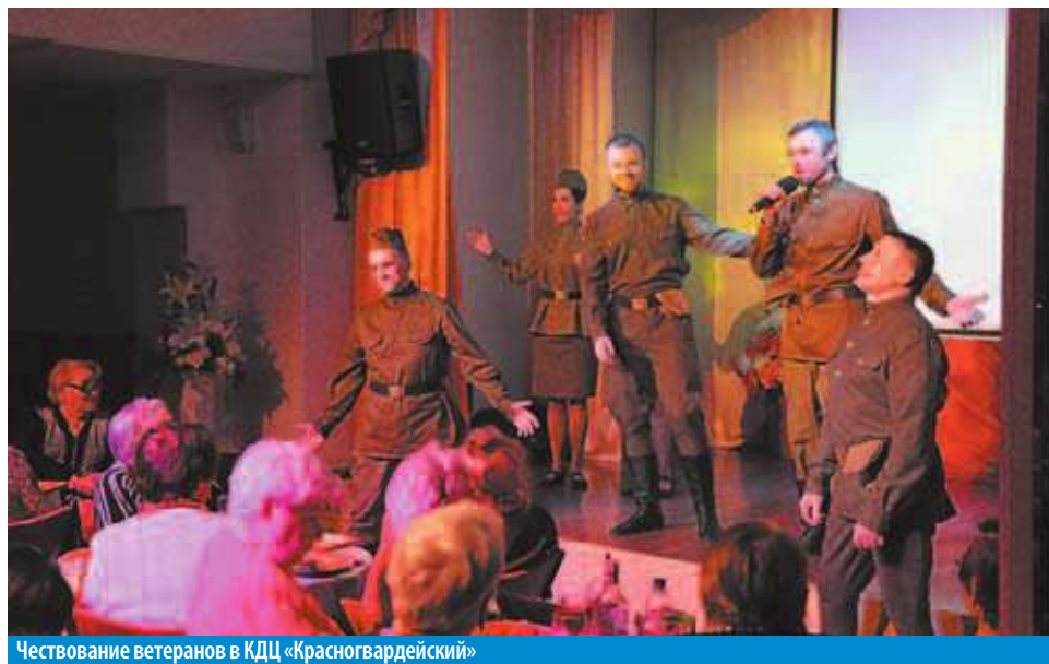
Чествование ветеранов в КДЦ «Красногвардейский»