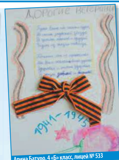
Арина Батуро, 4 «Б» класс, лицей № 533