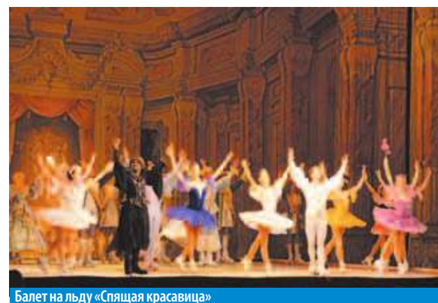
Балет на льду «Спящая красавица»

Подарком для всех жителей стал балет «Спящая красавица» в необычном исполнении – все актеры передвигались по сцене на коньках. Необычная постановка классического произведения пришлась по вкусу и юным зрителям, и заядлым театралам.