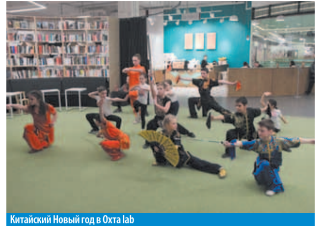
Китайский Новый год в Охта lab

Время уточняется – Городской открытый конкурс юных инструменталистов «Подснежник». ДДЮТ «На Ленской» (Ленская ул., 2, корп. 2).