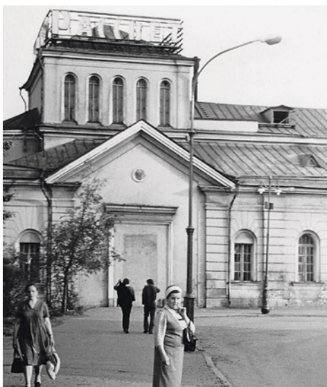
Кинотеатр «Рассвет», 1970 г.

Русский писатель, прозаик, автор реалистических повестей. Родился в семье дьякона. Учился в Александро-Невском духовном училище. Окончил Петербургскую духовную семинарию (1857). По окончании в ожидании места читал по покойникам, пел в церкви. В то же время занимался самообразованием, был вольнослушателем Санкт-Петербургского университета, работал в воскресной школе. В 1861 году в журнале «Современник» опубликовал повесть «Мещанское счастье» и «Молотов». В 1862–1863 годы в журнале «Время» и «Современник» печатались его «Очерки бурсы». Роман «Брат и сестра» и повесть «Поречане» остались неоконченными.