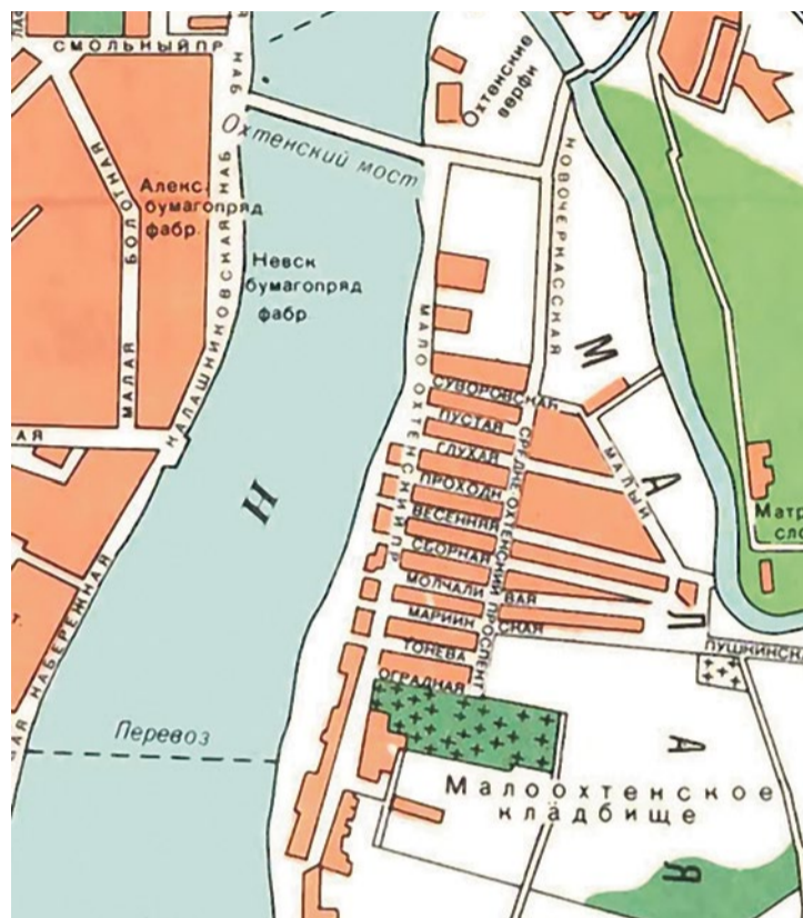
Фрагмент «Плана Санкт-Петербурга с ближайшими окрестностями», 1914 г.