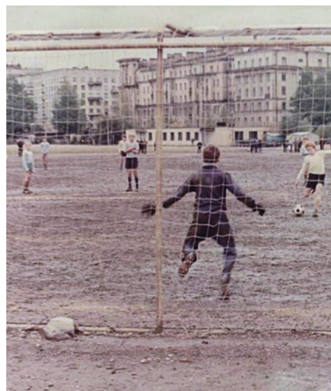
Стадион «Дружба», 1986 г.