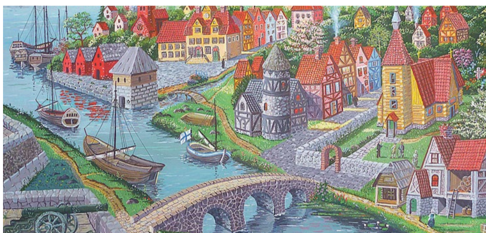
В. Иванов. Город Ниен с крепостью Ниеншанц

дах, воспользовавшись неразберихой Смутного времени, шведские войска вновь стали занимать города на северо-западе России. Весной 1611-го шведы заложили на Охтинском мысу земляную крепость Ньюенсканс, более известную под немецкоязычным названием «Ниеншанц» или русскоязычным «Канцы».