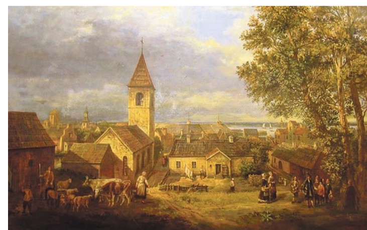
Э. Якушин. Вид на Ниен и Ниеншанц, 2011 г.