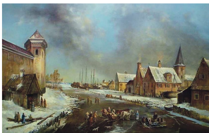
Э. Якушин. Ниен. Мороз перед Рождеством, 2013 г.

Историческая область на северо-западе современной России. Располагается по берегам Невы, ограничивается Финским заливом, рекой Нарва и Чудским озером на западе, Ладожским озером с прилегающими к нему равнинами и рекой Лава – на востоке. На севере она граничит с Карелией по рекам Сестра и Смородинка. Южная граница Ингерманландии проходит по среднему течению рек Оредеж и Луга.