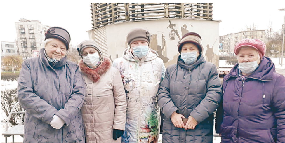
Актив Первичной организации №12 Совета ветеранов