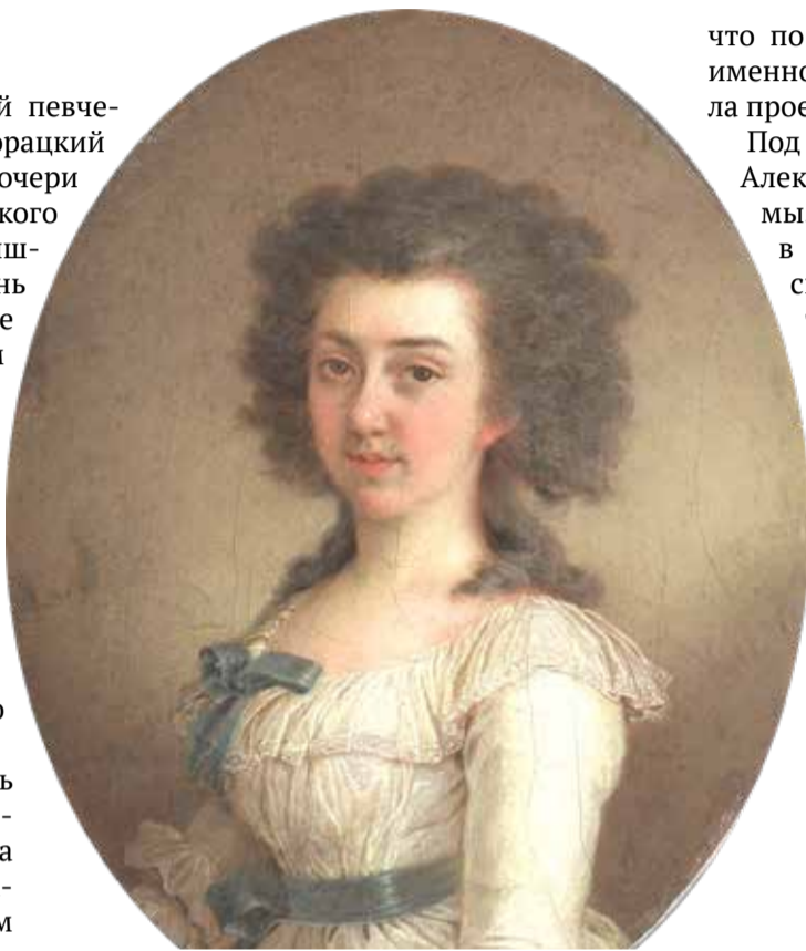
□ Портрет Елизаветы Марковны Полторацкой. В.Л. Боровиковский (1791 г.) Картон, масло. Место хранения: Государственная Третьяковская галерея, Москва.

Как отмечали современники, Агафокля Александровна умела зарабатывать буквально на всем —