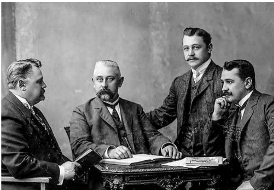
■ Братья Полежаевы