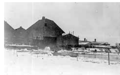
■ Момент спуска подводной лодки

В советское время Малая Охта сохраняла за собой статус промышленного района, однако в новом, XXI веке производственные предприятия уступают место жилой застройке и общественным пространствам. Однако память о промышленном наследии останется навсегда в литературе, культуре и особой мастеровитости и предпринимательской жилке, которая характерна для коренных жителей этой местности с незапамятных времен.