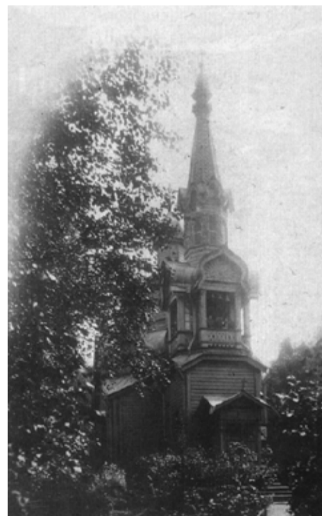
■ Церковь во имя Святого Благоверного Князя Александра Невского при Охтинском училище

Летом, 12 июля 1830 года, по указу Николая I при Охтинском пороховом заводе были учреждены две школы: начальная школа военных кантонистов и общая «Школа для образования мастеровых и подмастерьев порохового, селитряного и серного дел» для трех казенных пороховых заводов России. Помещение для общей школы, рассчитанное на 36 человек, находилось в одном из казенных домов Охтинского порохового завода. В созданное учебное заведение принимали мальчиков не моложе 16 лет. В основном учащимися становились сыновья мастеровых. Курс обучения был рассчитан на пять лет: три года было отведено на освоение теоретических предметов и два года — на практику. За время работы Пороховой школы (с 1830 года по август 1852 года, то есть за 22 года) было выпущено 40 мастеров и 70 подмастерьев.