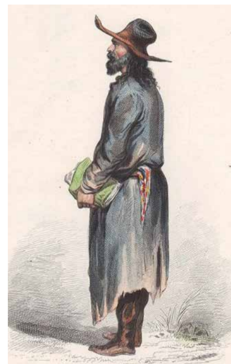
□ Школьный учитель. Санкт-Петербург. Рисунок середины XIX века для журнала Musee de Cosmopolite

Во многих школах на Охте заработная плата и вовсе не дотягивала до установленного минимума, учителям не давали жилья, а учить детей предлагалось в тесных и порой неотапливаемых помещениях. Большим подспорьем для учителей