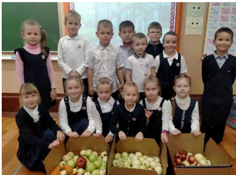
Акция «Дары Осени» в школе № 491