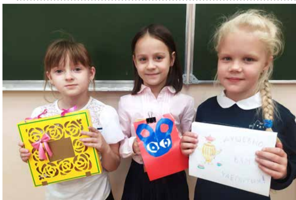
Акция «Самоварчик с добрыми пожеланиями» в школе № 491

Школа — это открытия, свершения и принятие самостоятельных решений.