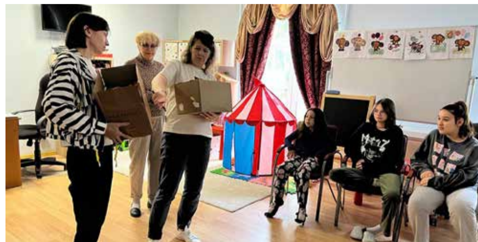
Акция «Огонек Добра» в школе № 491

Школа — это место, где ребята получают понимание о доброте и человечности.