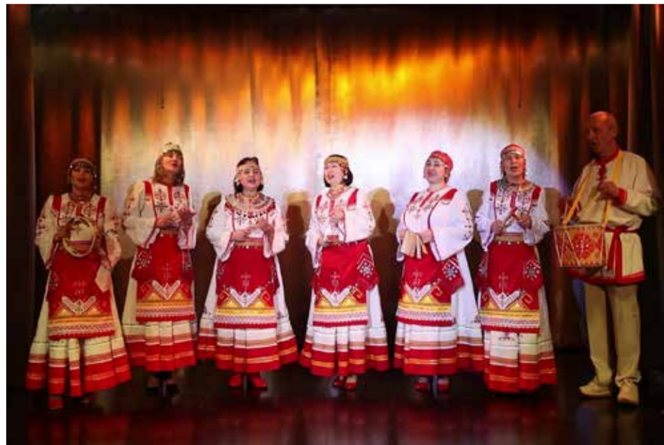
Чувашский фольклорный ансамбль «Телей»