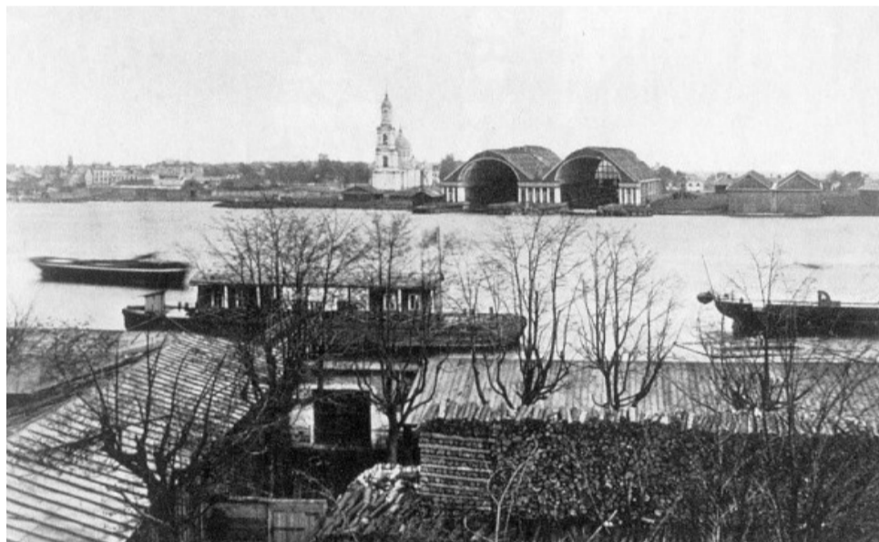
Охтенская верфь в 1880-1890 гг.

временного Летнего сада, по мнению ученых, и стало после перестройки Летним дворцом Петра I.