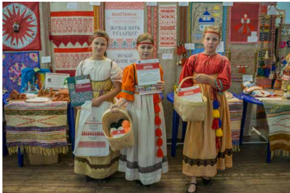
Вепсский центр фольклора

Буряты — национальность в Российской Федерации, этническая группа монгольской языковой группы, издревле населявшая просторы Сибири от Енисея до озера Байкал и Забайкалья, объединенная общей культурой и историей.