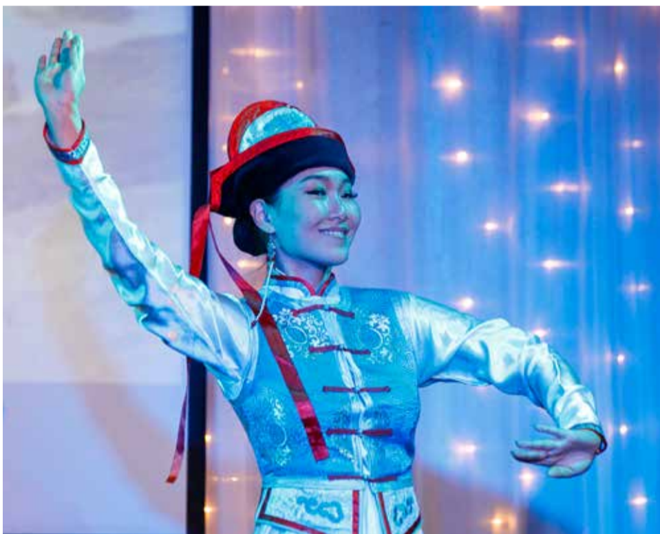
□ Бурятский творческий коллектив «Мунгэн шурэ»

коллектив «Мунгэн шурэ», в составе которого представители разных районов Республики Бурятия, Забайкальского края, Усть-Ордынского округа Иркутской области. В деталях диалекты, обычаи и традиции, манеры исполнения различаются в зависимости от того, к какому роду относится участник коллектива, но объединяет всех любовь к песне, сильное желание сохранить язык и культуру своего народа, знакомство и общение с национальными традициями других народов.