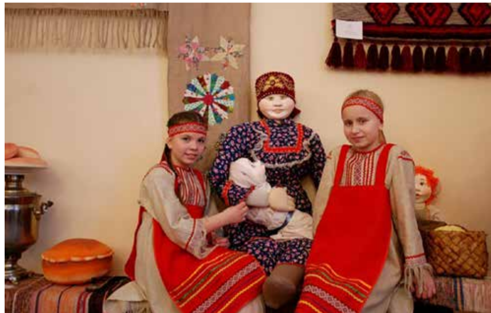
Вепсский центр фольклора

Идея создания вепсских коллективов возникла давно. В 1987 году по инициативе Комитета по культуре и Дома народного творчества в селе Винницы прошел первый областной праздник «Дерево жизни», который собрал представителей финно-угорского мира, после чего появилась возможность их организации. Постепенно появились коллективы, сохраняющие песни и танцы, рукоделие и ремесла, язык и эпос.