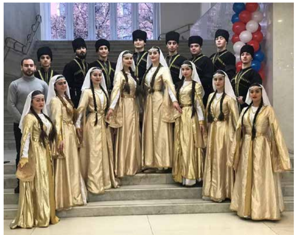
□ Ансамбль кавказского танца «Имамат»

с молодежью и распространения своего творческого опыта. Также в «Мунгэн шурэ» развито живое общение с молодежью в рамках разных мероприятий и проектов, что дополняет преемственность поколений, прямую передачу опыта и получение новых эстетических веяний современного мира искусства от молодых активных представителей народа.