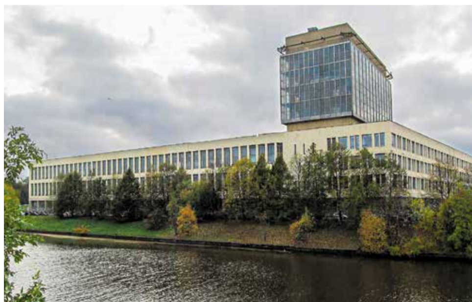
ЦКБМ на Красногвардейской площади