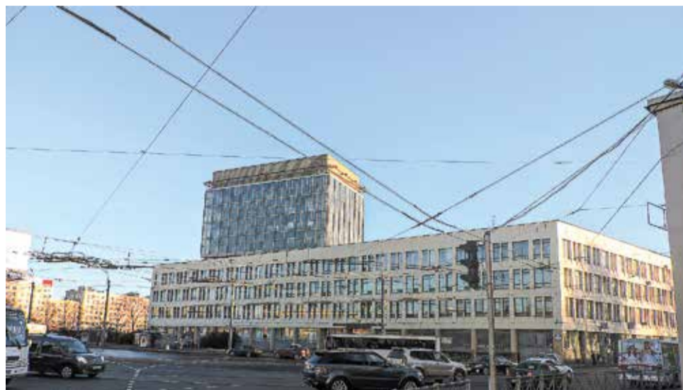
ЦКБМ на Красногвардейской площади

Левобережная часть площади также составляет часть ее архитектурного ансамбля. Здесь находится здание