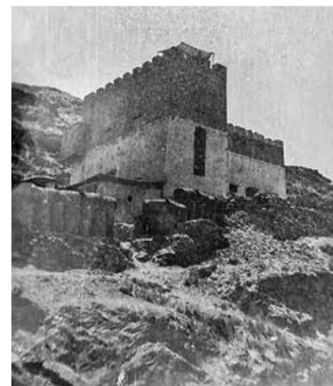
Военный пост № 16