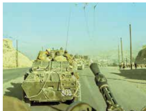
□ Перемещение медицинских групп усиления между городами

Можно думать все что хочешь. Каждый имеет право на личное мнение. Но выражать его нужно аккуратно и не тогда, когда твоя страна в опасности.