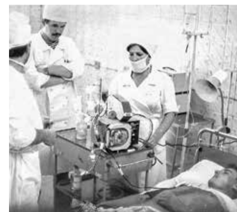
□ Проведение гемодиализа в Кабульском госпитале