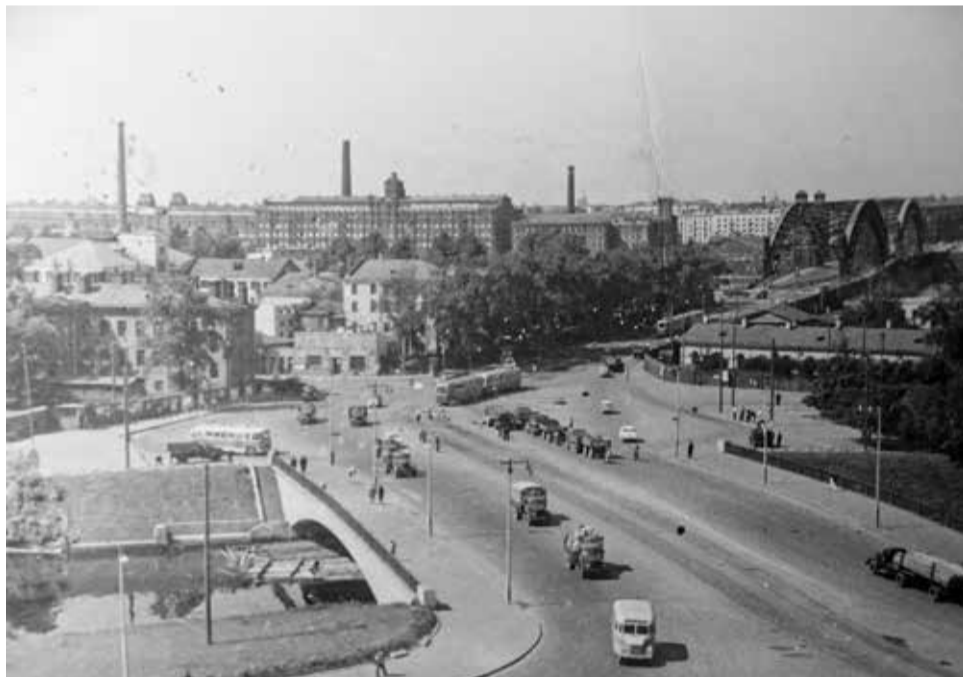
Красногвардейская площадь со строящегося «Дома Обуви», 1966 г.

В 1960–1970-е годы Красногвардейская площадь обросла массивными строениями. Среди первых трех зданий, построенных здесь, — три семизэтажных дома, которые по своей форме повторяют изогнутый правобережный контур площади. Застройка осуществлялась под руководством известных советских