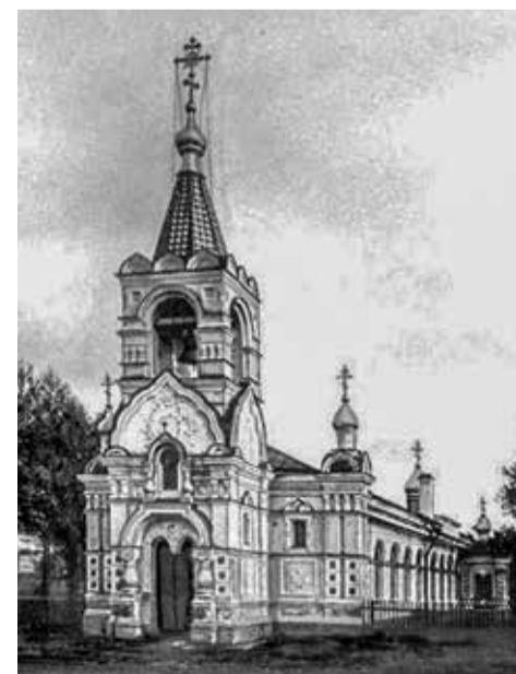
Церковь св. Александра Невского 145-го пехотного Новочеркасского полка