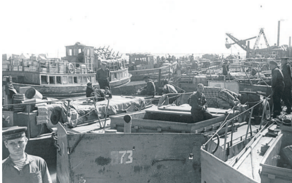
■ Тендеры у причала на Ладожском озере, 1943 г.

ПОСТРОИЛ «ПЕТРОЗАВОД» В 1942 г. ДЛЯ «ДОРОГИ ЖИЗНИ»