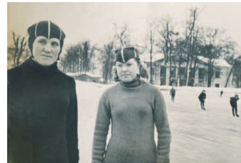
■ На школьном катке с преподавателем физкультуры, фотография 1951 г.

Закончив школу в 1951 г., я пошла работать к маме на Ленинградский