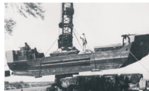
■ Погрузка тендера на ж.д. платформу, 1942 г.

Готовые суда грузили на железнодорожные платформы и отправляли на Ладожское озеро в порт Осиновец. Тягач стаскивал прибывший тендер с платформы на спусковой фундамент и по нему судно спускали на воду.