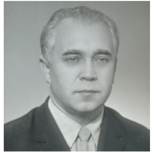
□ Преподаватель Ленинградского института текстильной и легкой промышленности, 1980-е

Радиолокаторов в то время еще не было. Чтобы обнаружить вражеские самолеты, использовался установленный на грузовом автомобиле огромный звукоулавливатель-рас-