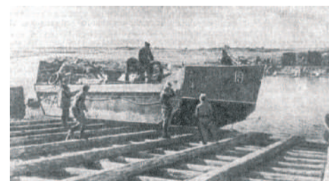
■ Спуск тендера на воду, 1942 г.

Адмирал В.Ф. Трибуц позднее вспоминал: «Нас выручили знаменитые тендеры, эти незамысловатые самоходные суда, созданные в тяжелую блокадную зиму руками голодающих рабочих в содружестве с нашими матросами. 10048 рейсов сделали тендеры за кампанию 1942 г.! Экипажи тендеров сквозь штормы, под огнем вражеских самолетов смело бороздили воды Ладоги. 158086 т продовольствия и боезапаса, 98800 воинов доставили они в осажденный Ленинград».