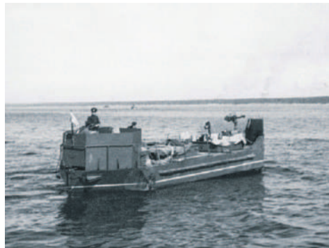
■ Тендер на переходе, 1943 г.

возможность перевозить грузы для осажденного города, а на обратном пути вывозить людей в эвакуацию. Плоское дно и закругленная носовая часть позволяли подходить к берегу даже при отсутствии причала.