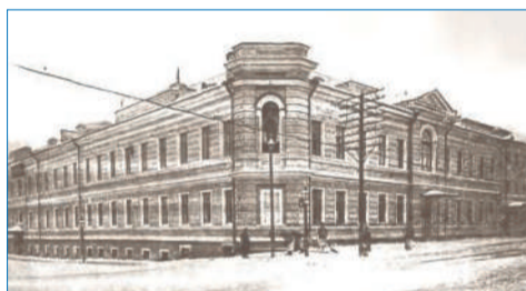
■ 4-классное училище в память императора Петра Великого

В 1896 г. на средства Охтинского Пригородного общества открылось начальное училище в память императора Александра III, а в 1899 г. – классное училище в память императора Петра Великого. В училища принимали детей почетных граждан, купцов, мещан, цеховых крестьян. В четвертом классе обучали различным ремеслам.