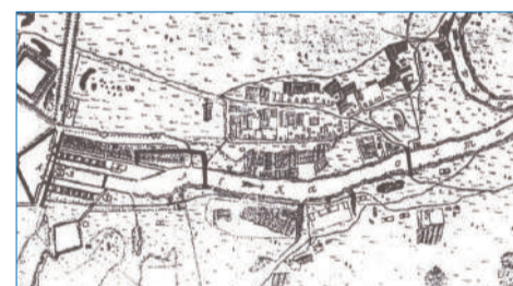
■ Карта. План Охтинского порохового завода. 1742

После упразднения в 1863 г. Округа военных поселений Охтинского порохового завода, реформировались и школы на Пороховых. Вместо школы кантонистов появилась всесословная школа селения Пороховых. Бесплатная школа Охтинского порохового завода была построена и открыта в 1867 г. (ныне – Поселковая ул., д. 11А). В первый год в школе обучалось 40 детей, в 1870 г. – 70, в 1875 – 110. Преподавали Закон Божий, церковное пение, русский язык, чистописание, арифметику, рукоделие.