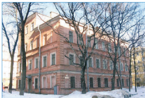
■ Здание Охтинского детского приюта