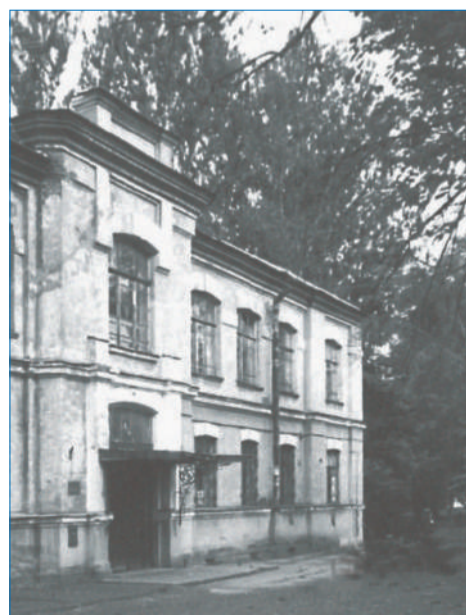
■ Здание Охтинского механико-технического училища. Архитекторы В. Цейдлер, Н. Чижов

Ремесленное училище 1 сентября 1897 г. преобразовано в Охтинское механико-техническое училище. Попечителем училища стал камер-юнкер Двора его Императорского величества старший советник С. П. фон-Дервиз. В училище принимали юношей с 15 лет. Обучение было платным, но бедных учеников от платы освобождали. Училище имело 4 класса, готовили техников – помощников инженеров, чертежников, а также квалифицированных рабочих. Ученики проходили практику на заводах. Выпускники училища поступали слесарями, железнодорожными техниками в паровозные мастерские, машинами при паровых машинах, чертежниками, разметчиками, сборщиками на заводы.