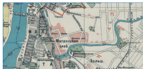
■ Карта. Охтинское механико-техническое училище, начало XX в.