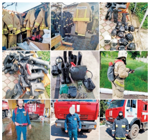
Поставка амуниции донецким пожарным

Немного расскажу о себе. Я родилась в городе на Неве, жительница Малой Охты. Люблю свой родной район. Часто бываю в командировках в других городах и странах, но всегда с радостью возвращаюсь домой. Помимо сбора гуманитарной помощи, в фонде я занимаюсь