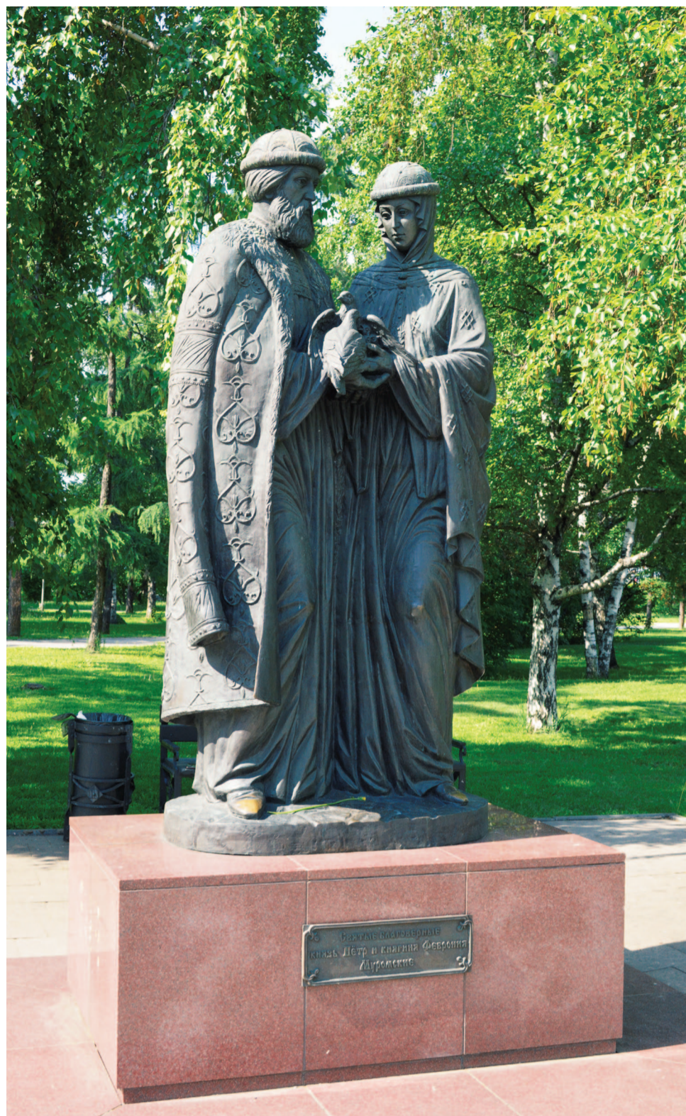
■ Памятник святым Петру и Февронии, г. Иркутск

С 2009 года в рамках общенациональной программы «В кругу семьи» скульптурные композиции святых Петра и Февронии стали устанавливать в других городах России. Великолепный памятник украшает вход в белокаменную Спасскую церковь Иркутска, в Омске – находится в сквере у Концертного зала Омской филармонии, напротив Никольского казачьего собора, в Ростове-на-Дону – в парке Октябрьской революции, в Ярославле – на Первомайском бульваре, рядом с Волковским театром, неподалеку от собора Казанского монастыря, в Архангельске – вблизи храма Успения Пресвятой Богородицы, в Волгограде – на центральной набережной, в Великом Новгороде – рядом с Покровским собором. В Туле, Калуге, Перми, Йошкар-Оле, Апатитах, Самаре, Екатеринбурге, Ижевске, Тамбове, Чебоксарах и Белгороде также стоит отлитая в бронзе молодая супру-