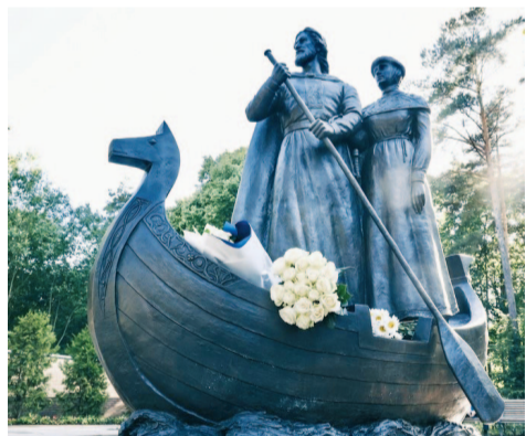
■ Памятник святым Петру и Февронии, пос. Солнечное

Эта история потрясла до глубины души жителей средневековой Руси. Летописное сказание монаха переписывали и передавали из уст в уста, из поколения в поколение. И до сих пор эта красивая история служит примером и образцом для подражания среди семейных пар. Даже день, когда оба супруга скончались – 25 июня 1228 года, а по новому стилю – 8 июля – считается Днем семьи, любви и верности. Через 300 лет после смерти их причислили к лику святых. И этот день стал своеобразным днем уважения и почитания людей, скрепивших свои отношения узами брака. И перерос в красивый праздник, ставший народным. Его отмечают сегодня в 40 странах мира. Считается, что своими молитвами Петр и Феврония низводят небесное благословение на вступающих в брак.