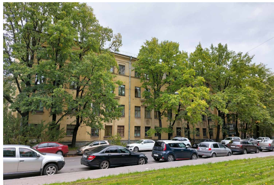
■ Школа № 151 на Республиканской (Мариинской) ул., (№4 в 1940 г.), д.16, в дальнейшем – Школа рабочей молодежи, ныне Военный комиссариат Красногвардейского района, пункт отбора на военную службу по контракту. Фотография, 2023 г.

В августе 1881 г. по инициативе председателя общества Попечительства о слепых К.К. Грота открылось первое в Петербурге Александромариинское училище для слепых. В июне 1888 г. началось строительство для него здания на Песочной улице, 37 (архитектор А.И. Томишко), а в сентябре 1889 г. открылись двери для первых 120 питомцев от 5 до 17 лет. В день 25-летия общества Попечительства о слепых 18 октября