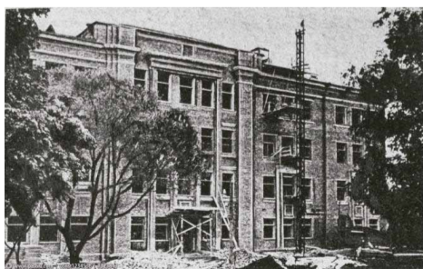
■ Строительство школы № 499 на Весенней ул. (№31 в 1940 г.). Фотография, 1939 г.

Из воспоминаний Н.Н. Коноваловой Разместили школу рабочей молодежи в очень красивом лесу у озера, в старинном здании бывшего заводоуправления фабрики «Пятилетка», сохранившегося от Охтенских пороховых заводов. Первая в стране фабрика по производству вискозного шелка во время войны выпускала