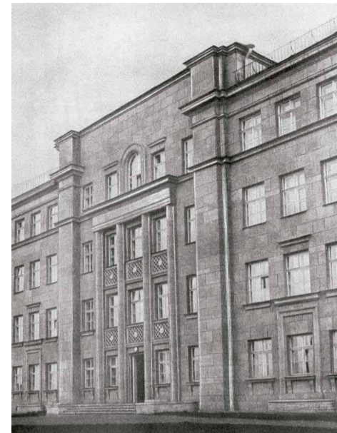
■ Школа № 152 на Таллинской ул. (ныне адм. корпус завода «Северный пресс»). Фотография, 1940 г.

1906 г. перед Александромариинским училищем торжественно открыли памятник К.К. Гроту. В послереволюционные годы начали преподавать предметы: физкультуру, географию, историю, физику, а также ввели детское самоуправление. В 1923 г. создана пионерская организация, открыты литературные и музыкальные кружки, для воспитанников читали газеты. После начала войны 7 июля 1941 г. школу эвакуировали. Вернулась она в Ленинград из эвакуации летом 1945 г. и разместились на Аптекарском острове. В 1963 г. для школы построено здание на пр. Шаумяна, 44. Памятник К.К. Гроту перенесен к новому зданию.