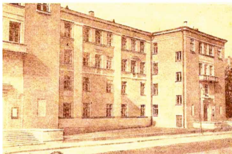
■ Проект здания школы (ныне Лицей № 533). Рисунок, 1938 г.