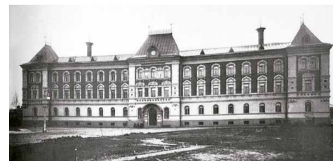
Здание богадельни Елисеевых. Фотография мастерской К. Буллы, 1913 г.

141-я школа имеет более чем вековую историю. Шесть раз она меняла название и несколько раз переезжала. Школа – преемница гимназии