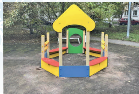
■ Таллиннская ул., д. 22