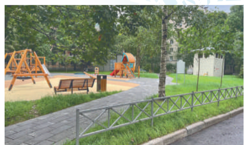
■ ул. Рижская, д. 14