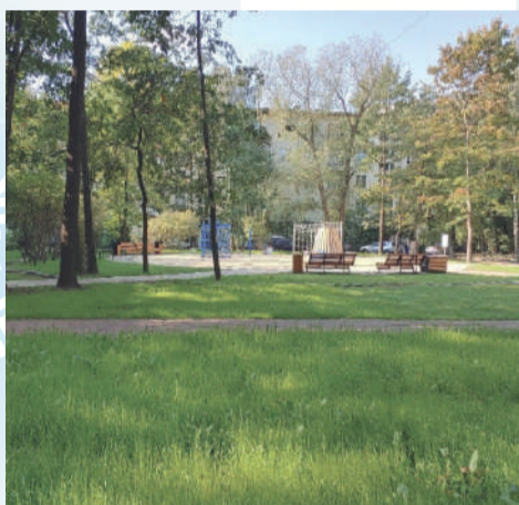
■ ул. Гранитная, д. 8-10

При реализации проектов были выполнены работы по устройству травмобезопасного покрытия, установлено детское игровое и спортивное оборудование, посажены кусты, многолетние цветы, деревья, установлены урны, скамейки, газонные ограждения.