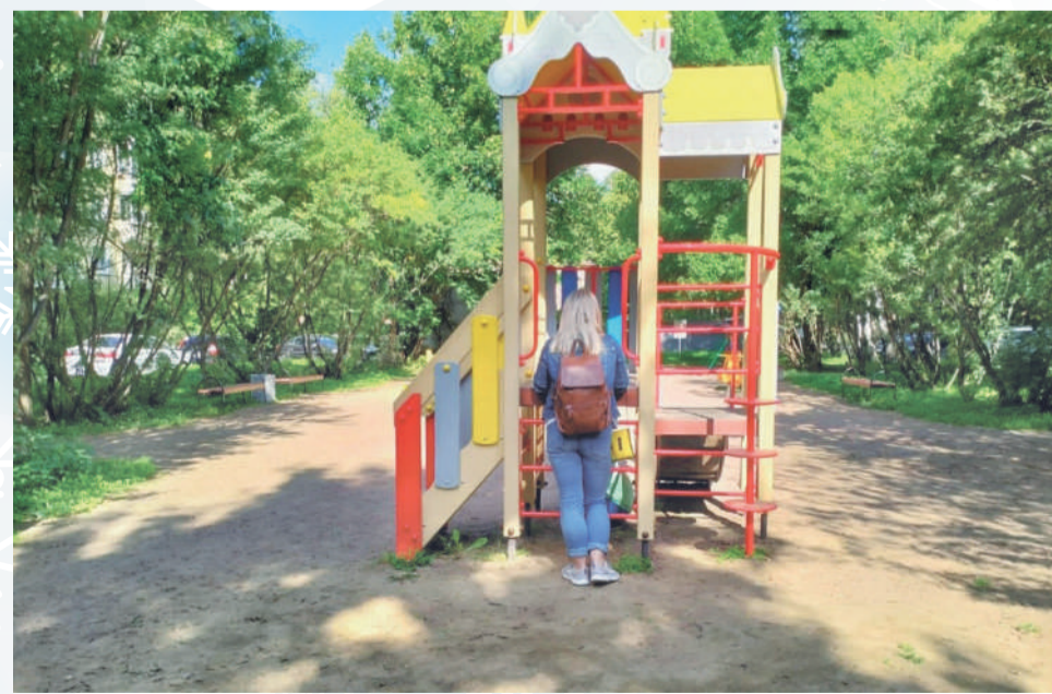
■ Проспект Шаумяна, д. 33