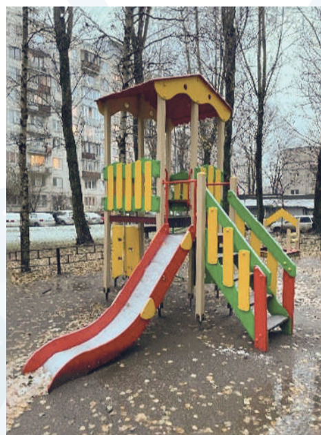
■ Заневский пр., д. № 43, 45, 47

В целях более эффективного подхода к расходованию бюджетных средств, в текущем году был реализован новый метод в проведении реконструкции детских площадок, что сократило временные и финансовые затраты. Произведена отдельная замена морально и технически изношенных игровых комплексов на особо востребованных площадках, не внося существенных изменений в общий облик. Выполнена замена детского игрового и спортивного оборудования на детских площадках по 7 адресам. Установка детского игрового оборудования на детских игровых площадках.