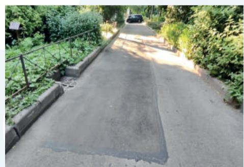
■ Ремонт асфальтового покрытия: Гранитная ул., д. 52