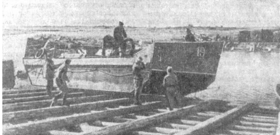
□ Спуск тендера на воду в порту Осинец на Ладожском озере. Фотография, 1942 г.

Моряки придумали, как увеличить грузоподъемность судна. Выхлопная труба от двигателя выходила на левый борт и находилась на высоте всего на 15 см выше ватерлинии. Она всегда должна быть над водой, чтобы не залило двигатель. Экипажи наварили на выхлопную трубу вертикальный патрубок. Это позволило увеличить осадку на 25 см, и брать на 1 т груза больше, без существенного ухудшения скорости и поворотливости судна.