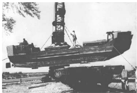
□ Погрузка тендера на железнодорожную платформу на «Петрозаводе». Фотография, 1942 г.

Готовые суда грузили на железнодорожные платформы и отправляли в порт Осинец на Ладожском озере. В порту тросы стаскивали прибывший тендер с платформы на спусковой фундамент из бревен и по нему судно спускали на воду.