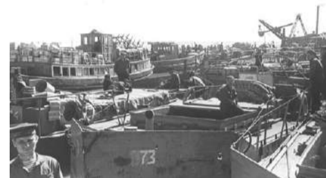
□ Тендеры в порту на Ладожском озере. Фотография, 1942 г.