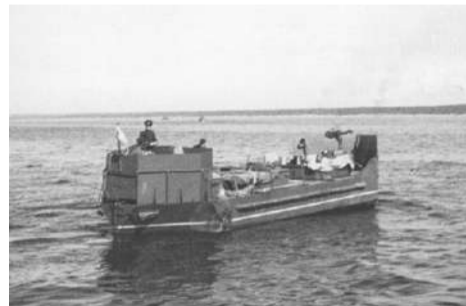
□ Тендер на переходе. Фотография, 1942 г.

Днем и ночью суда ходили по трассе Кобона – Осинец. Каждый рейс требовал от личного состава огромного напряжения. Продолжался переход в одну сторону около 2,5 часов. Рейс туда и обратно с погрузкой и выгрузкой занимал около 6 часов. И так круглосуточно. Уход за кораблем и его двигателем тоже ежедневно требовал время и силы.