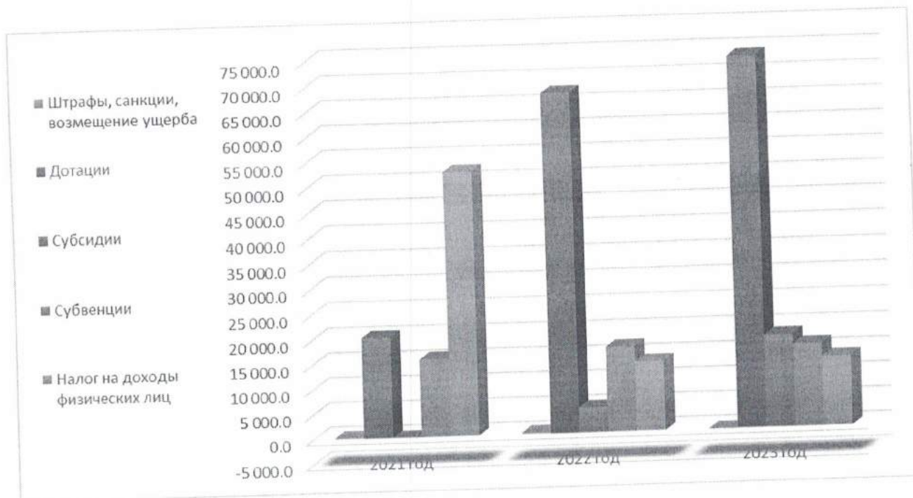
Диаграмма 3 Тыс. руб.