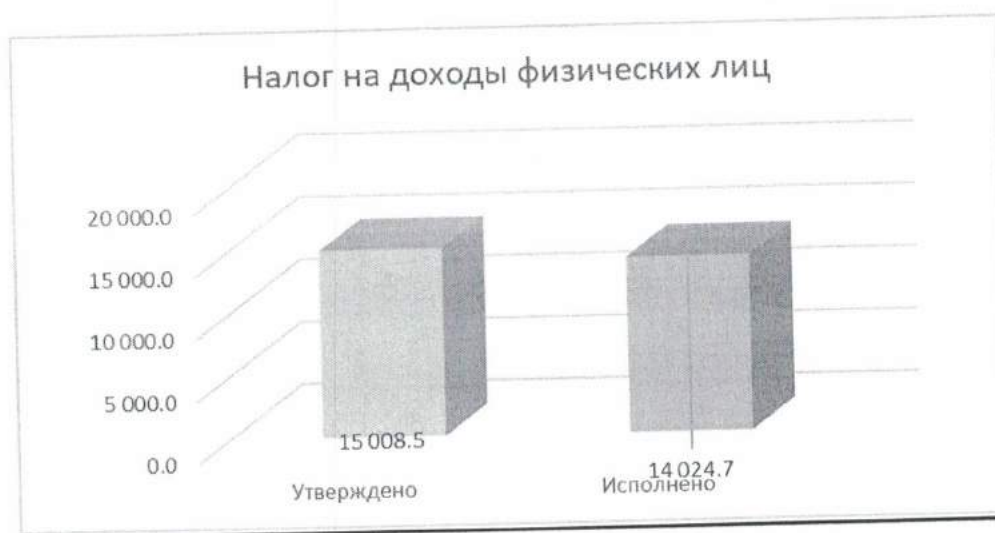
Диаграмма 2 Тыс. руб.

Структура налоговых поступлений представлена на диаграмме 2: