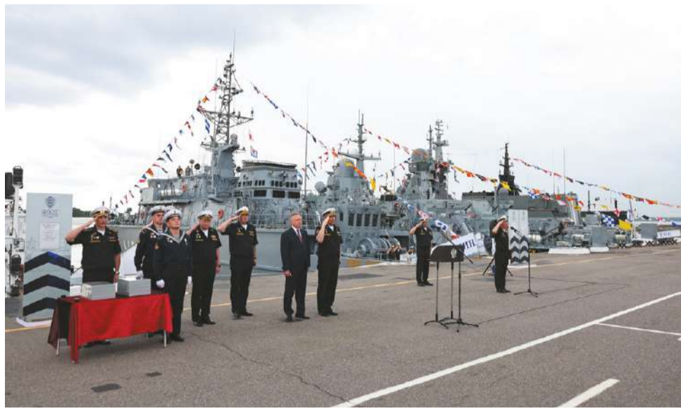
■ Открытие военно-морского салона

Александр Беглов, губернатор Санкт-Петербурга