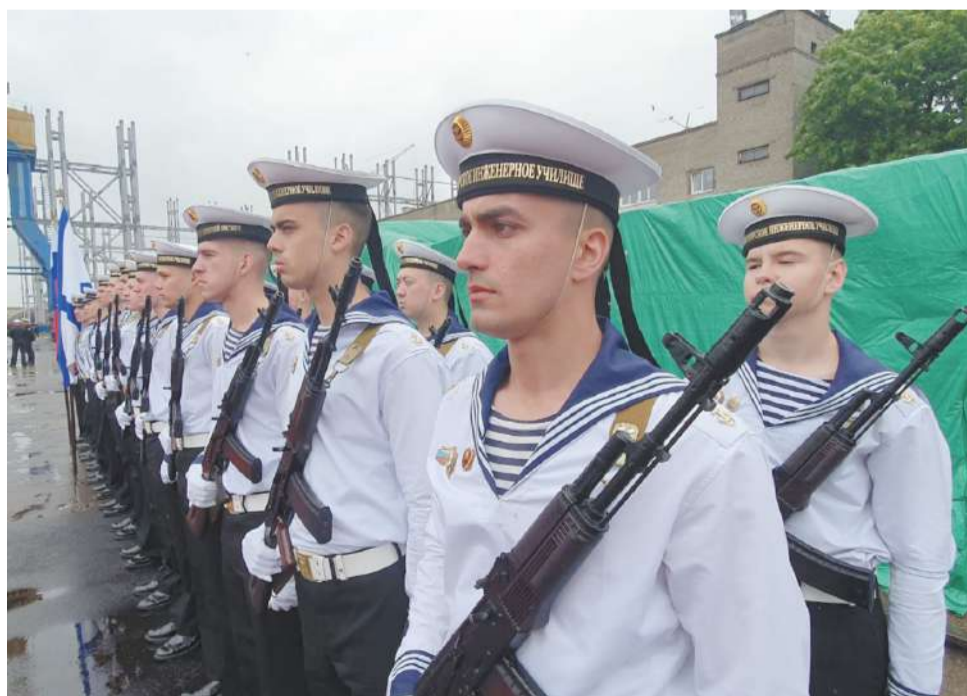
■ В торжественном строю на открытии салона.

На Камчатке уже сформирован экипаж для нового боевого корабля, который сейчас проходит подготовку и впоследствии будет проводить все необходимые испытания перед передачей корвета в состав Военно-морского флота.