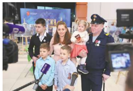
■ В историческом мултимедийном парке «Россия – моя история» состоялась торжественная церемония открытия Года семьи в Санкт-Петербурге. Также в мероприятии приняли участие семьи участников СВО.

В Санкт-Петербурге есть и своя награда для многодетных – почетное звание «За заслуги в воспитании детей». Первую степень присваивают за воспитание семи и более детей, вторую – пяти и шести детей, третью – четырех. Всего с 2021 года его удостоились 182 семьи. Сопутствующие выплаты при этом выросли кратно: если раньше к званию 1 степени полагалось 100 тыс. рублей, сейчас эта сумма составляет 500 тыс. рублей (за вторую и третью – 300 тыс. вместо 100 и 100 вместо 25 тыс. рублей соответственно).