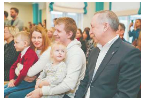
■ Губернатор Александр Беглов на церемонии открытия нового детского сада.

С января 2025 года начнет действовать федеральный национальный проект «Семья»: к концу