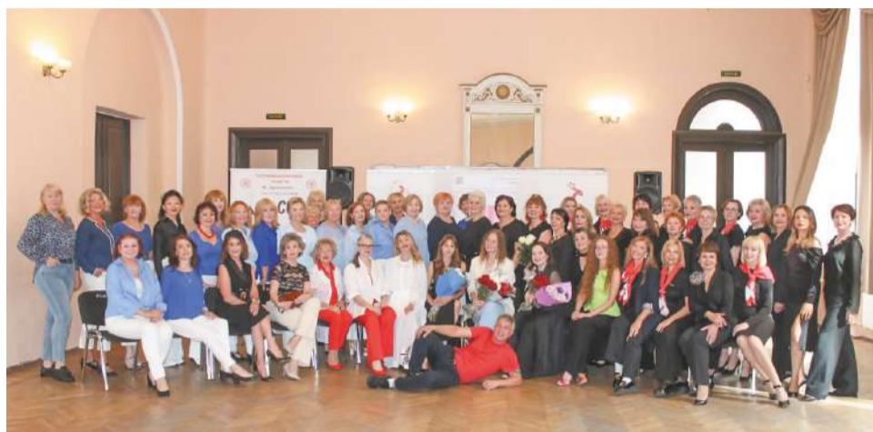
Группа моделей 55+

В крупных городских ТЦ предусмотрено открытие центров ранней