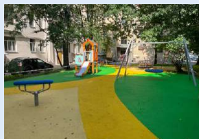
Малоохтинский пр., д. 84 (стало)

В 2024 году было проведено комплексное благоустройство детской площадки у дома №15 по Таллинской улице. При реализации проекта выполнены работы: установка детского игрового и спортивного оборудования, устройство травмобезопасного покрытия, установка урн,