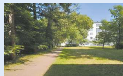
ул. Таллинская, д. 15 (стало)