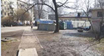
пр. Шаумяна, д. 39 (стало)