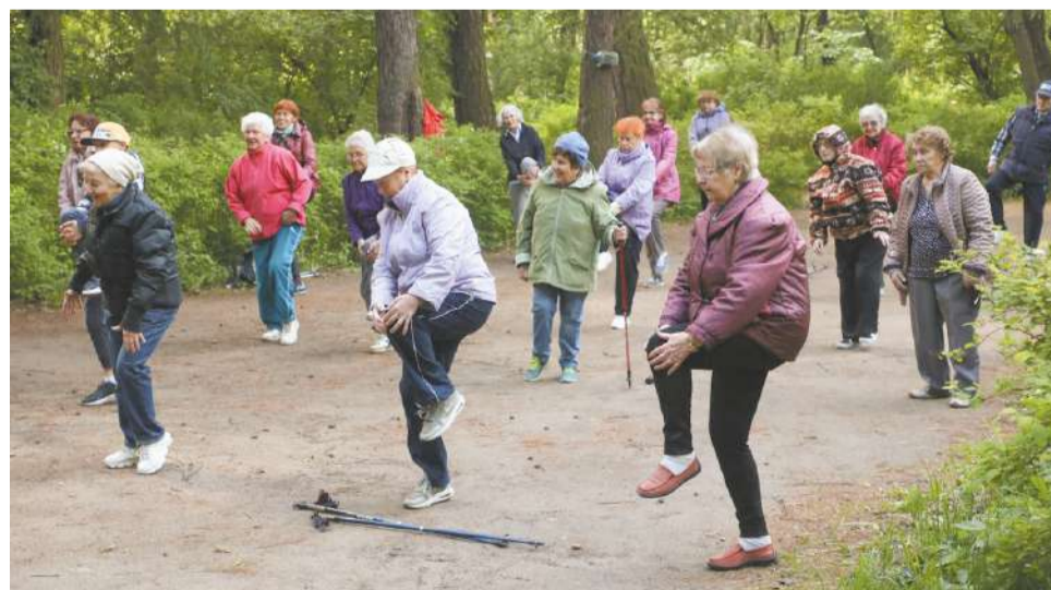
Группа здоровья «Оптимисты».

Средняя продолжительность жизни в Санкт-Петербурге уже сейчас на 3 года выше, чем в целом по стране: 76 лет и 73 года соответственно. Справедливо будет предположить, что через пять лет (таков срок реализации нового проекта) эта цифра еще увеличится.