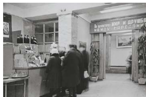
■ Очередь в буфет

Расписание кинотеатра всегда можно найти на официальном сайте http://www.peterburg-kino.spb.ru/zanevsky , любые вопросы можно задать по телефону: +7 (812) 444-37-85 или в группе https://vk.com/kinozanevsky .