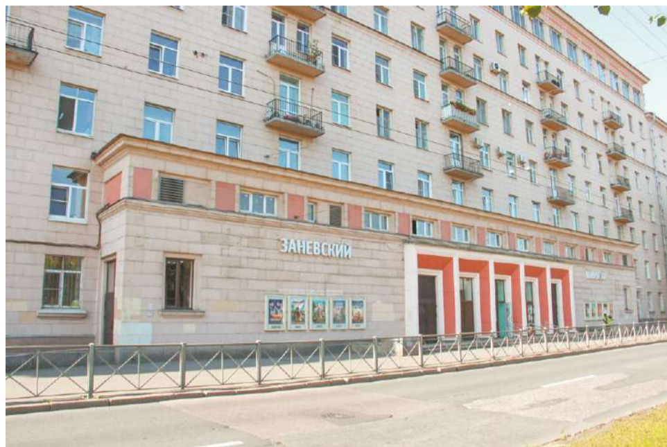
■ Кинотеатр «Заневский», наши дни

Кассы располагались в отдельном помещении (сегодня это «Семейная гостиная»). При входе в основное помещение имелось небольшое кафе, где можно было поесть вкусных пирожных или просто перекусить, после чего прогуляться по просторному фойе, полюбоваться портретами артистов, афишами и выставками творческих работ, почитать газеты. И только потом пройти в один из двух залов с довольно небольшим по сегодняшним меркам экраном и деревянными сиденьями, чтобы с удовольствием посмотреть фильм.