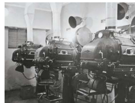
■ Оборудование аппаратной

образный репертуар. Для любителей классики отечественного кино регулярно проходят кино клуб с увлекательными лекциями и бесплатные показы, приуроченные ко многим праздничным датам.